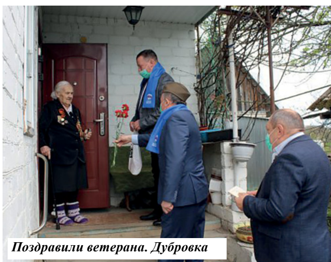
Поздравили ветерана. Дубровка