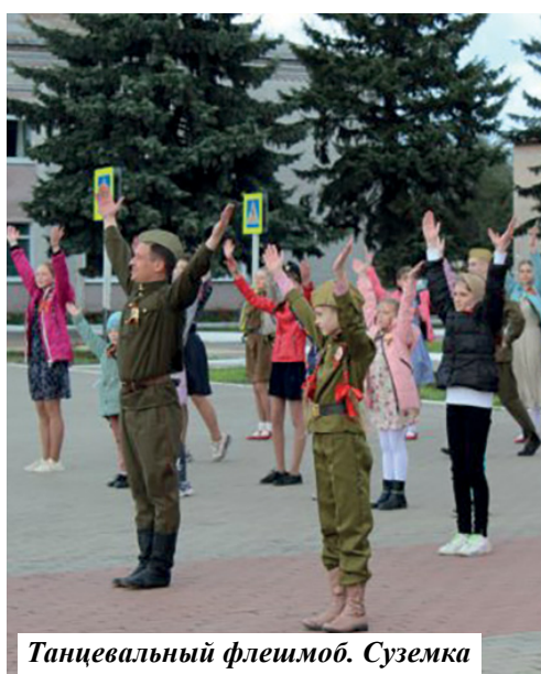
Танцевальный флешмоб. Суземка