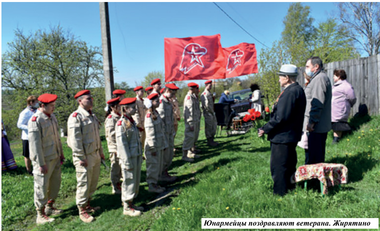
Юнармейцы поздравляют ветерана. Жирятино