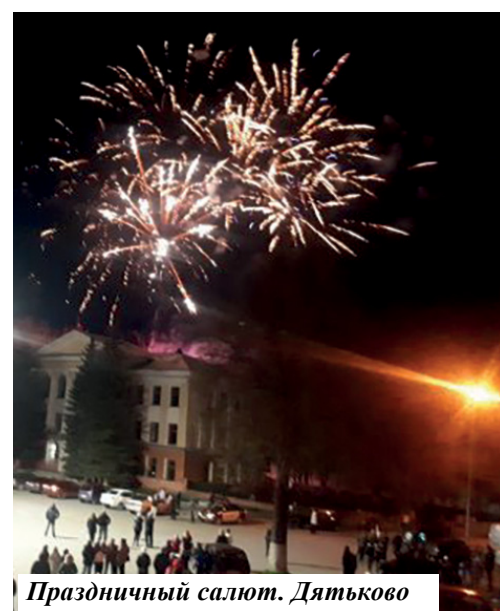
Праздничный салют. Дятьково