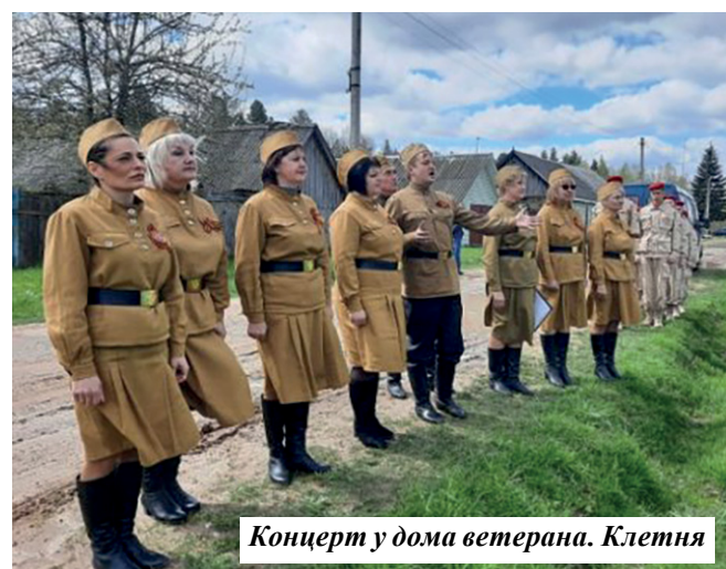
Концерт у дома ветерана. Клетня