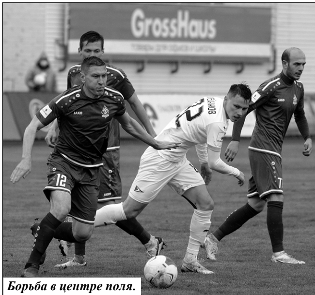
Борьба в центре поля.

Брянское «Динамо» сыграло заключительный домашний матч в ФНЛ.