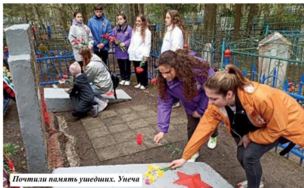
Почтили память ушедших. Унеча