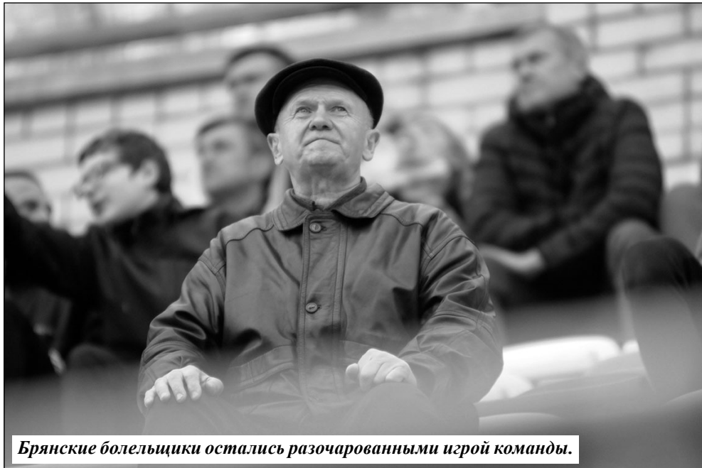
Брянские болельщики остались разочарованными игрой команды.

Вторая половина встречи получилась более богатой на события. «Динамо» должно было открывать счет на 68-й минуте, но защитник Георгий Горозия не использовал свой шанс при пробитии удара с 11-метровой отметки. А вот за девять минут до ис-