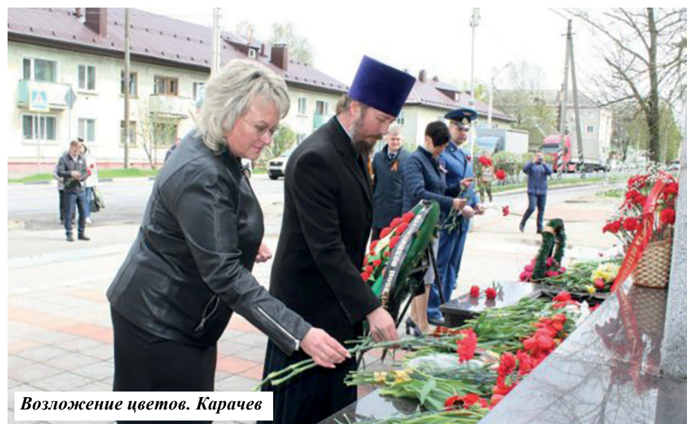
Возложение цветов. Карачев