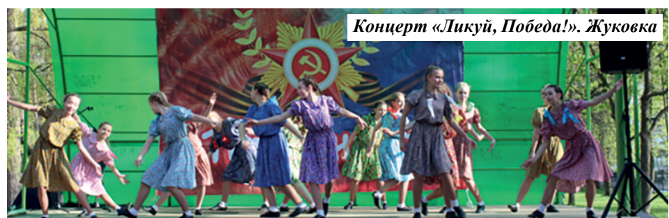
Концерт «Ликуй, Победа!». Жуковка