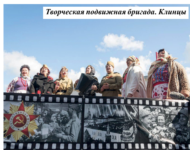
Творческая подвижная бригада. Клинцы